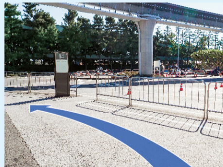
⑦ 14番の標識の先にある、横断歩道まで進みます。