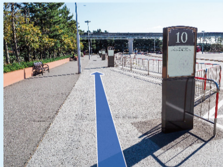
⑥ 14番の標識を目指して進んでください。