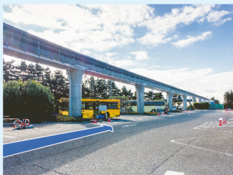
⑨ さらにまっすぐ進むと、バスの停留所に到着です！