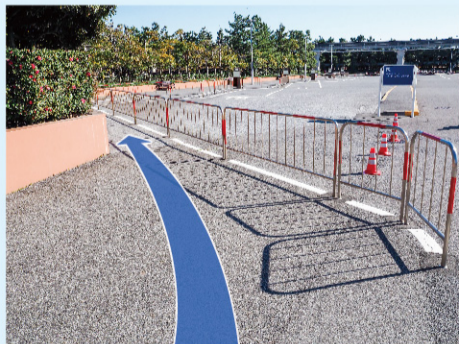
⑤ 柵の内側(歩道)を進みます。