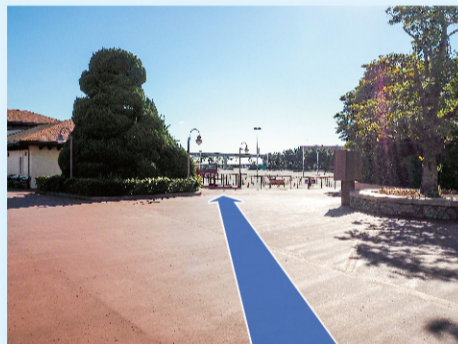
② 駐車場が見えてきますので、まっすぐ進みます。