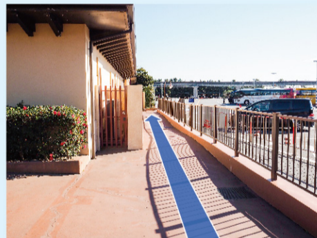
③ 駐車場に通路があるので、直進します。