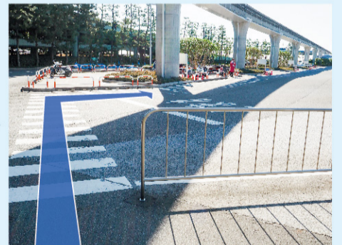
⑧ 横断歩道を渡りきったら、右方向に進みます。