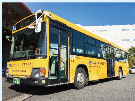
⑩ 乗車いただくのは黄色いシャトルバスです。 ※循環バスのため、発車直前に到着します。