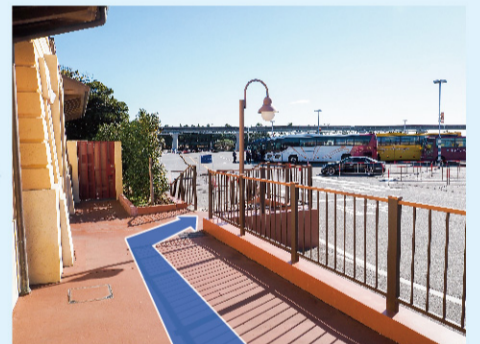
④ 下りの階段をおります。