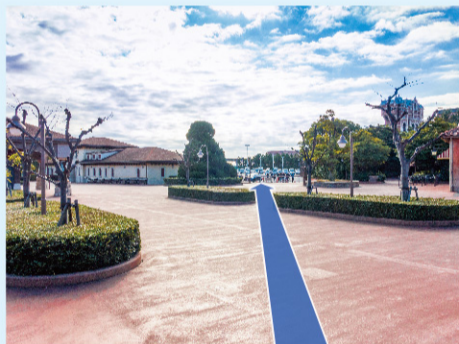
① 右手のサウスゲートを出て、右斜めに進みます。 ※右側にお土産屋さんを見ながら直進します。