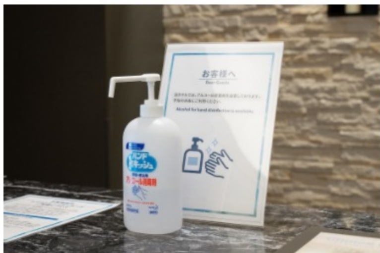
アルコール消毒剤の設置