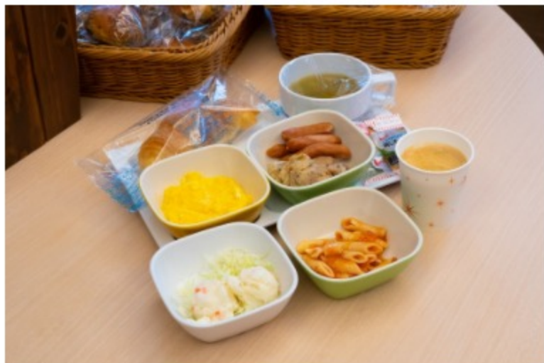
無料朝食の一部メニュー停止