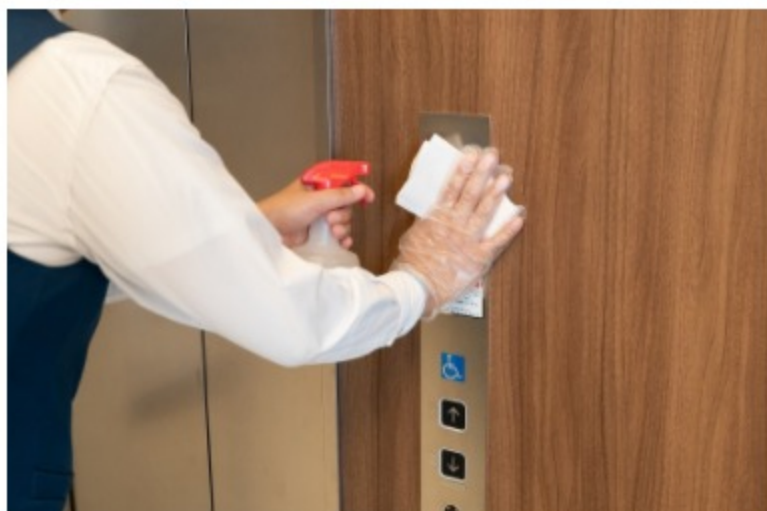
パブリックスペースの拭き取り