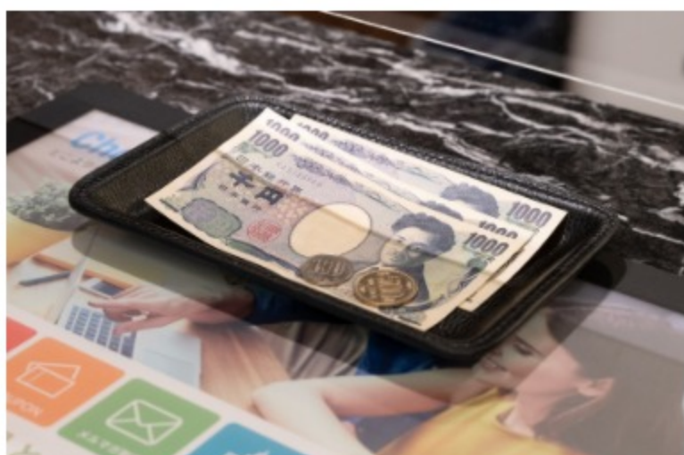
トレーでの受け渡し