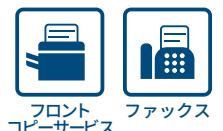
フロントコピーサービス