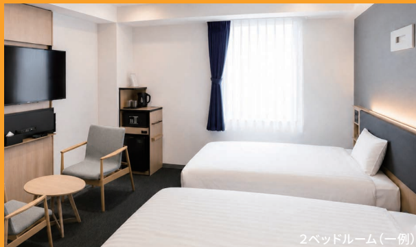
2ベッドルーム(一例)