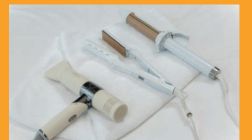
ヤーマンリフトドライヤー(全客室設置) KINUJO 2WAYアイロン(貸出備品)