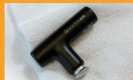
ボディケアアイテム(貸出備品)

客室設置備品 目覚まし時計/電気ケトル/保冷庫/ポケットコイルマットレス/歯磨きセット/シャンプー/ヘアコンディショナー/ボディソープ/フェイスタオル/バスタオル